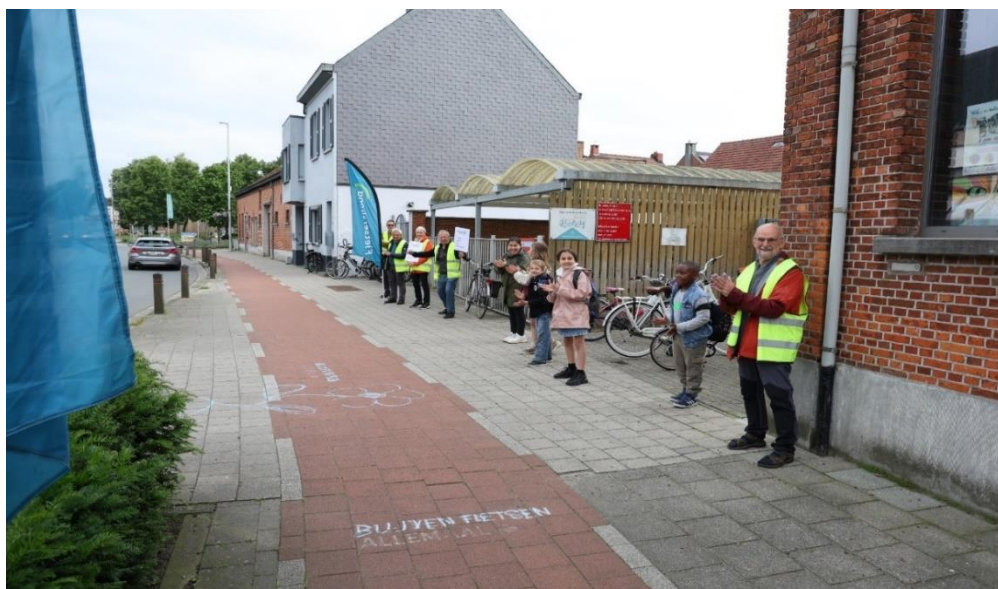
Applausactie op 3 juni, Wereldfietsdag, aan De Omnibus.