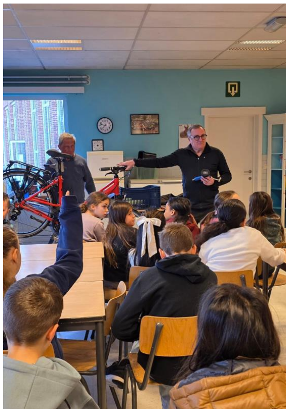
Les in enkele plaatselijke lagere scholen over het onderhoud van de fiets.