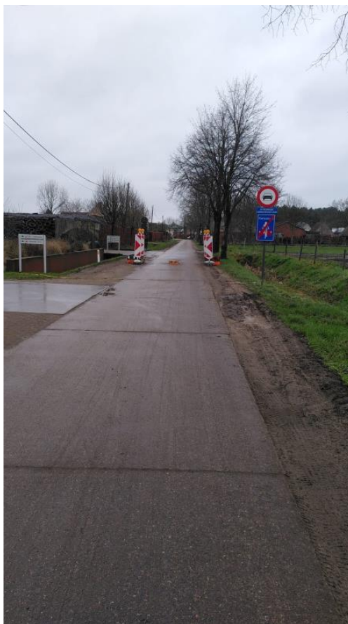
De inrichting van Klein Broek als fietsstraat en het plaatsen van een tractorsluis.