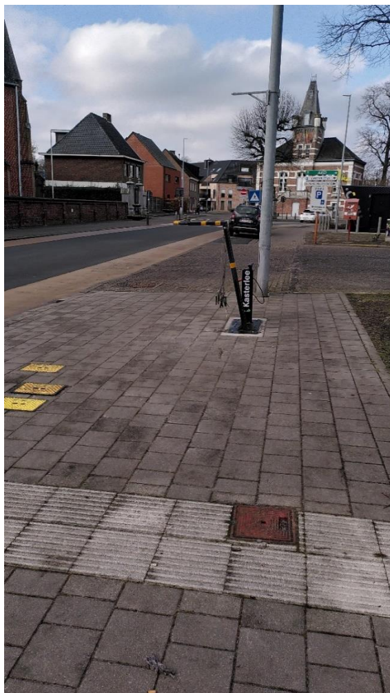
Plaatsen van fietsherstellingszuilen in de dorpskernen.