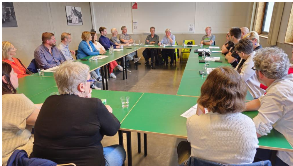
Voorstelling van ons memorandum voor de plaatselijke politieke partijen voor de gemeenteraadsverkiezingen 2024.