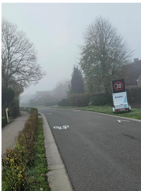
Verlenging zone 30 in de Molenstraat.