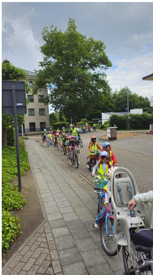
Begeleiding van fietsende schoolkinderen.