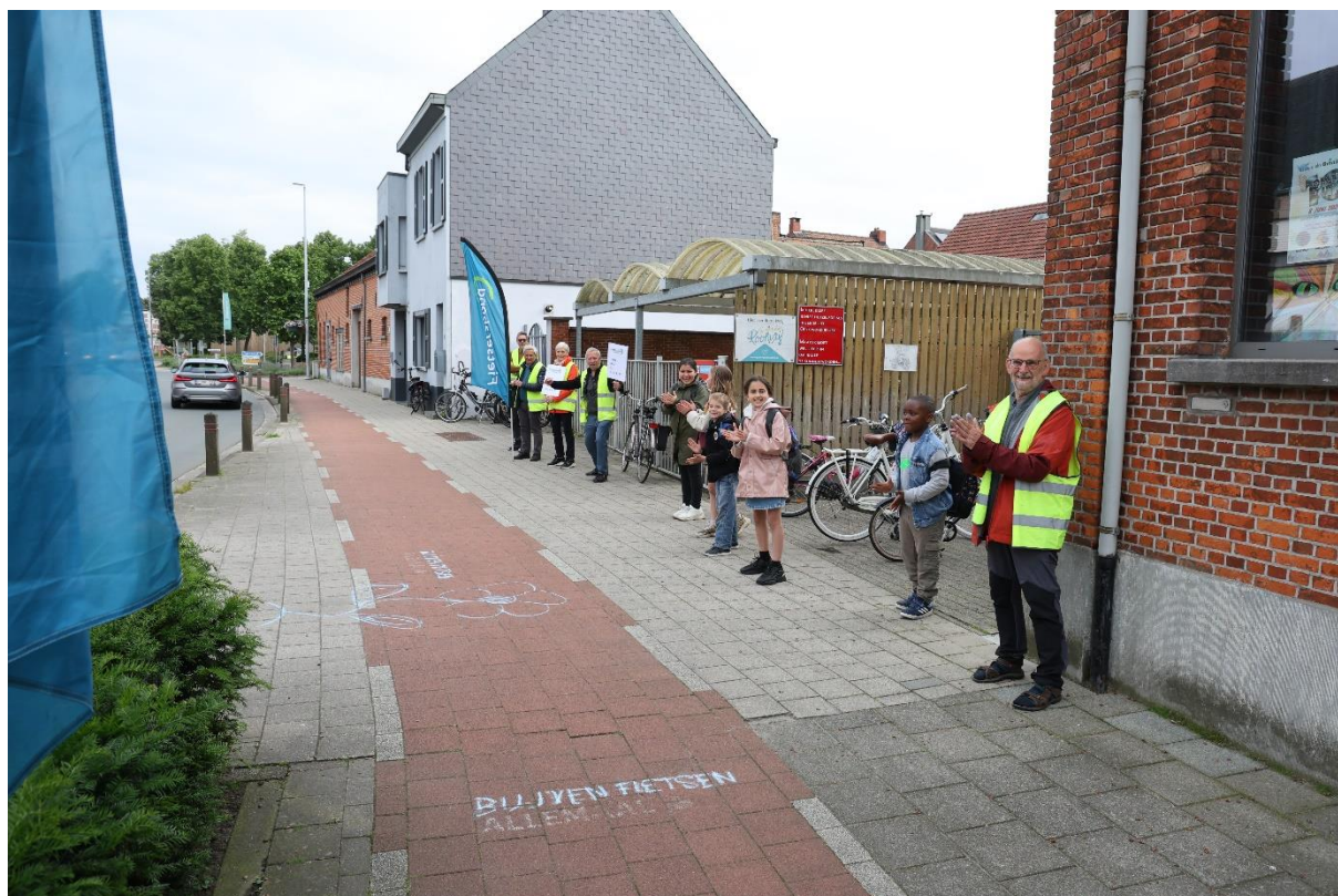
Applausactie aan De Omnibus Tiel en op 3 juni 2024, Wereldfietsdag