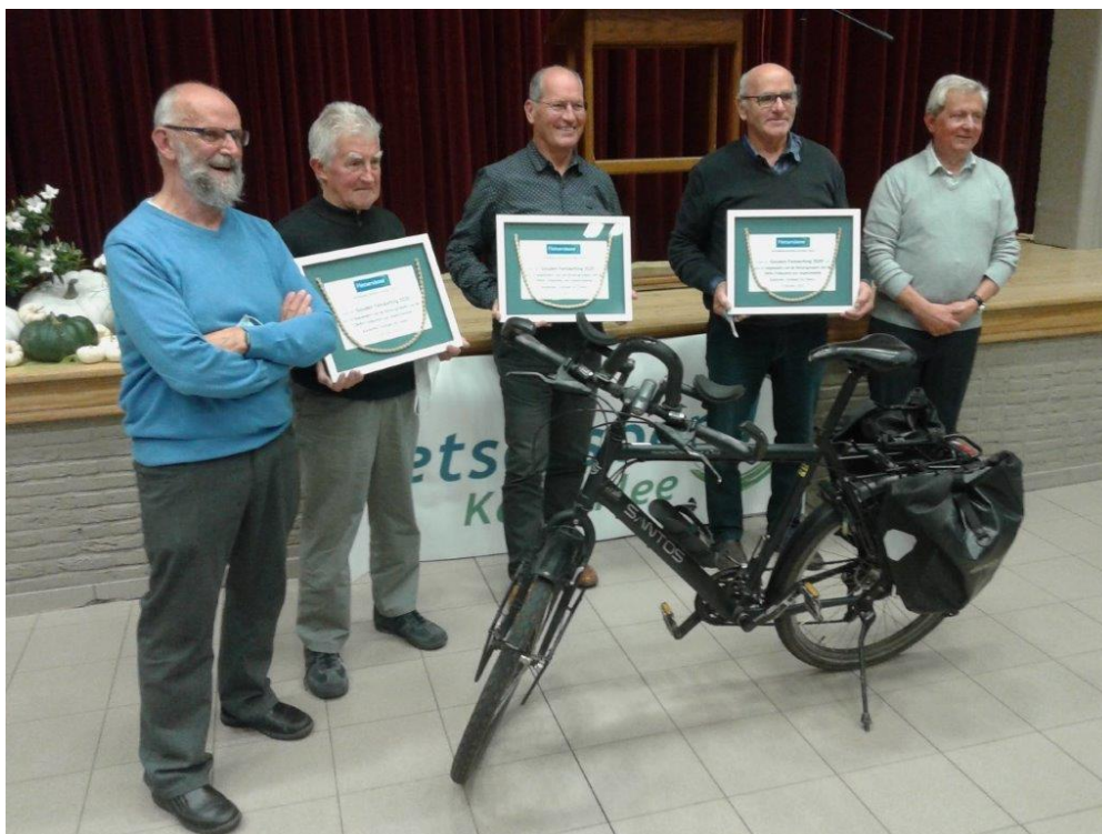
Uitreiking van “de gouden fietsketting” op 9 oktober 2020 aan de begeleiders van de fietsgroepen van OKRA van de drie deelgemeenten