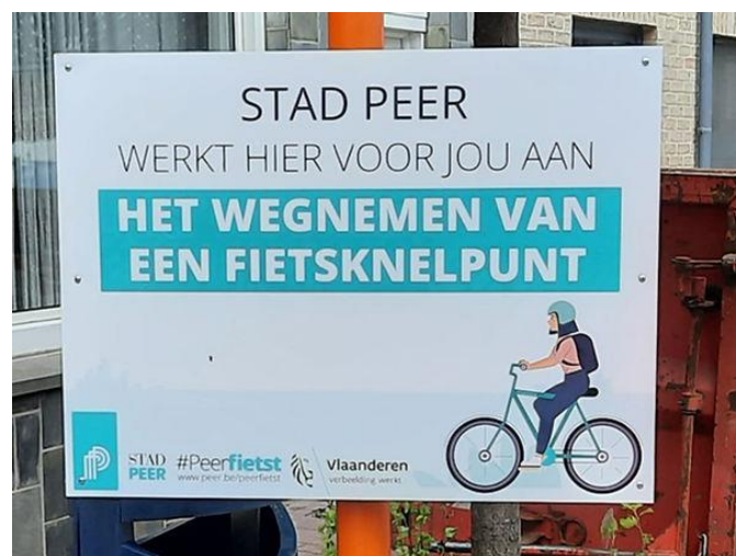
Aankondigingsbord van werken in de stad Peer