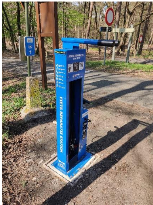
Een van de acht fietsherstellingszuilen in Hamont-Achel.