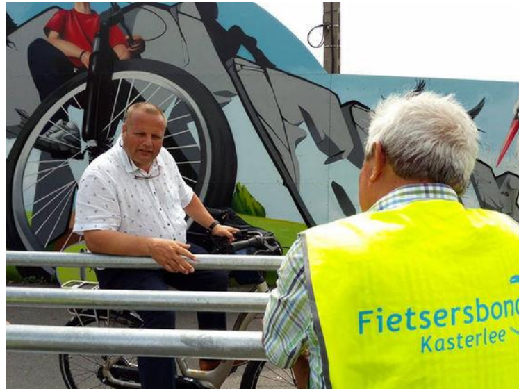
De fietsherstellingzuil als ontmoetingsplaats. Bezoek FB Kasterlee aan fietsgemeente Bonheiden in juni 2018.