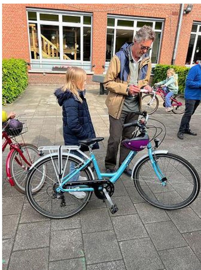
Fietsennazicht op 7 mei 2024 bij GBS De Vlieger