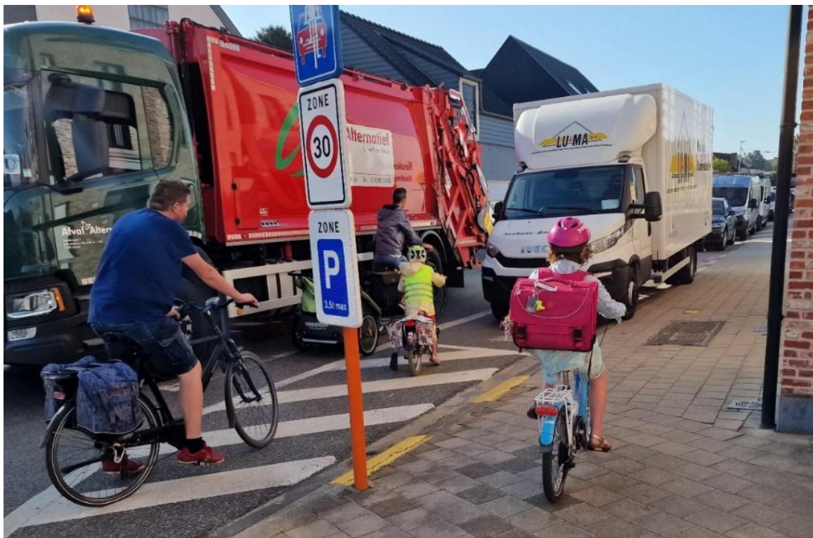
Et ceci n'est pas une fietsstraat (Zagerijstraat)