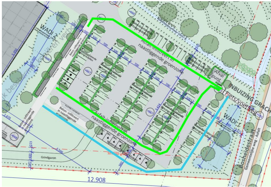
Figuur 4. De ontsluiting voor fietsers en voetgangers langs de Bosheidestraat is enkel toegankelijk langs de autoparking. Lichtgroene pijlen geven de verwachte bewegingen aan van voetgangers en fietsers. De lichtblauwe route is wenselijk, maar niet voorzien op de plannen.