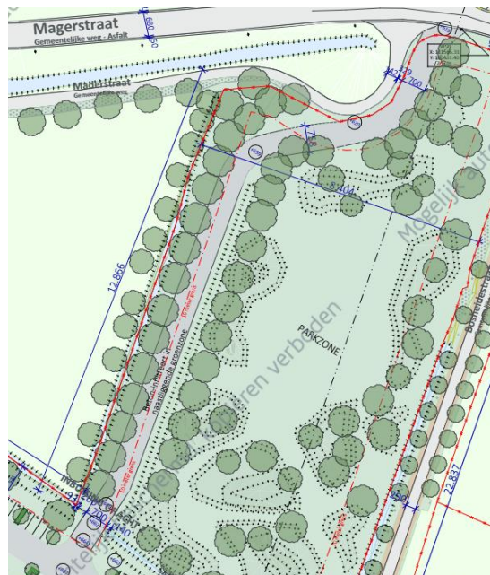
Figuur 2. Een lange verbindingsweg vormt de ontsluiting naar de Magerstraat.