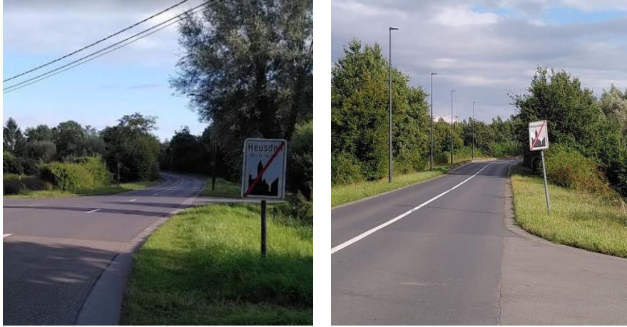
Figuur 5. Magerstraat (links) en Steenvoordestraat (rechts), beide in de richting weg van Heusden dorp, en naar de sportsite toe. Vanaf de voet van de brug wordt de bebouwde kom verlaten, en geldt maximaal 70 km/u. Dit is onverantwoord snel voor wegen met gemengd verkeer. We vragen een zone 30, zodat fietsers veilig de sportsite kunnen bereiken.